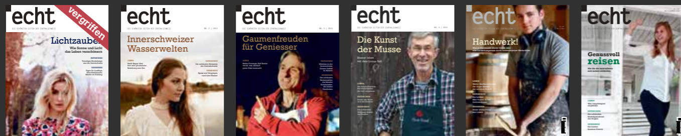
echt # 1/13 Lichtzauber echt # 2/13 Wasserwelten echt # 3/13 Gaumenfreuden für Geniesser echt # 4/13 Die Kunst der Musse echt # 1/14 Handwerk! echt # 2/14 Genussvoll reisen

Ja. Ich will echt (4 Ausgaben / Jahr) abonnieren – jetzt zum Spezialpreis von Fr. 35.– (statt Fr. 50.–). Ich nehme damit an der Verlosung teil.