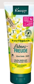
SONNIGER DUFT Pflegedusche Lebensfreude, mit ätherischen Ölen der Litsea cubeba und der Zitrone. Kneipp.swiss und Migros CHF 5.50