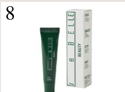
8 EIN HAUCH VON VANILLE Veganer Lippenbalsam für einen glossigen Effekt. Nährt und pflegt. In der Schweiz hergestellt. Von rebellebeauty.ch CHF 14.90