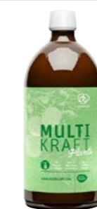
PFLANZEN STÄRKEN Multikraft Plants fördert die Widerstandsfähigkeit von Gemüse und Kräutern. multikraft.com, 1 Liter Konzentrat CHF 27.80