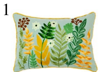
1 DAS SOFA BEGRÜEN Kissen Flower Garden aus Baumwolle, in Häkeltechnik bestickt, bei scouthand-made.ch, 35 x 50 cm CHF 59.–

Die Gärtnerinnen und Gärtner unter uns sind längst am Setzlinge-Ziehen und Pflänzchen-Verhätscheln. Allen anderen sei gesagt: Auch ein Blumenstrauss daheim schafft Frühlingsgefühle! Redaktion: Barbara Halter