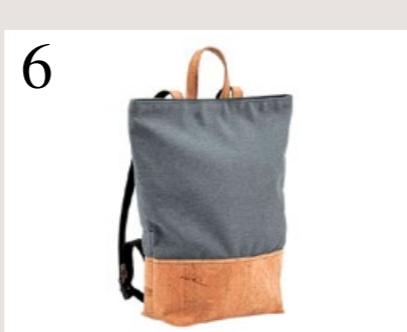
6 KORK STATT LEDER Wetterfester und leichter Rucksack Simaru aus Kork und Stoff. Verstellbare Höhe von 50 bis 65 cm. korkeria.ch CHF 145.–