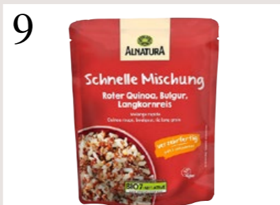
9 EINE BOWL IM HANDUMDREHEN Die Schnelle Mischung aus roten Quinoasamen, Bulgur und Langkornreis ist vorgegart. Bei Alnatura, 250 g CHF 2.90