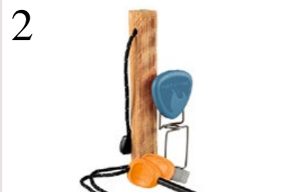
2 FEUER BEI JEDEM WETTER Mit dem Feuerset Light My Fire fliegen die Funken und lassen sich Gaskocher oder Feuer-späne entzünden. Bei hajk.ch CHF 27.90