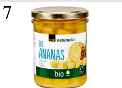
7 FRÜHLINGSDESSERT Die erste Ananas im Glas mit Bio- und Fairtrade-Label, in Scheiben oder Würfeln. Von Coop Naturaplan, 240 g CHF 2.50