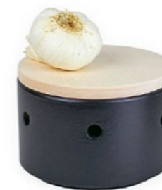
ORDNUNG IN DER KÜCHE Knollentopf, um Knoblauch oder Zwiebeln aufzubewahren. Stapelbar, aus glasiertem Steingut. Bei fideadesign.com CHF 65.–