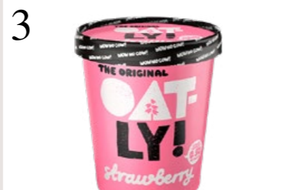
3 ZEIT FÜR GELATI Das neue Eis von Oatly ist vegan und auf Haferbasis hergestellt. Bei Coop erhältlich, 500 ml, CHF 5.95