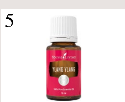
5 EXOTISCHE BLÜTEN Ein paar Tropfen Ylang-Ylang-Öl in die Feuchtigkeitscreme gibt weiche Haut. Bei youngliving.com/de_DE, ca. CHF 69.–