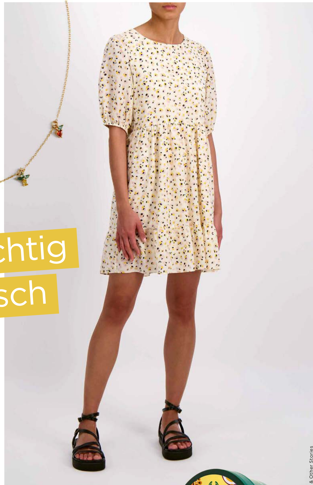
& Other Stories

Diese knackige Badebombe entfacht pfirsichfarbene Wirbel in der Wanne. Perfekt, wenn es mal wieder heiss herging. Den fruchtigen Duft genießt man alleine oder – wenn genug Platz in der Wanne ist – zu mehreren. Fr. 11.50 lush.ch