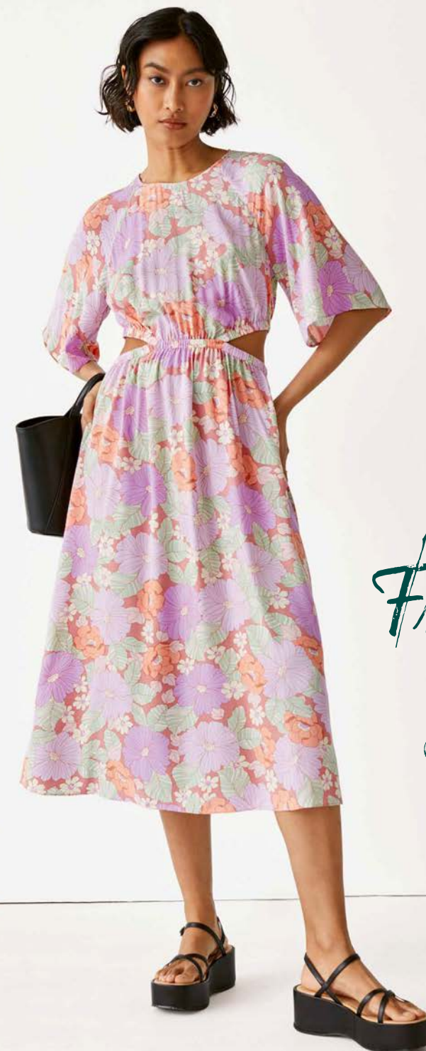
& Other Stories