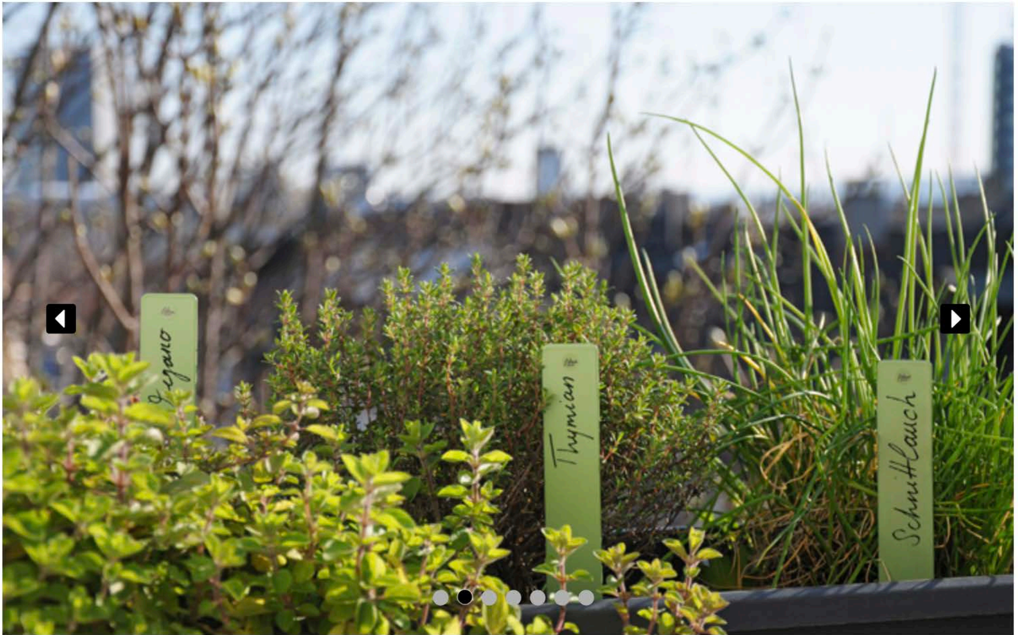
Meine Mutter war eine passionierte Gärtnerin....