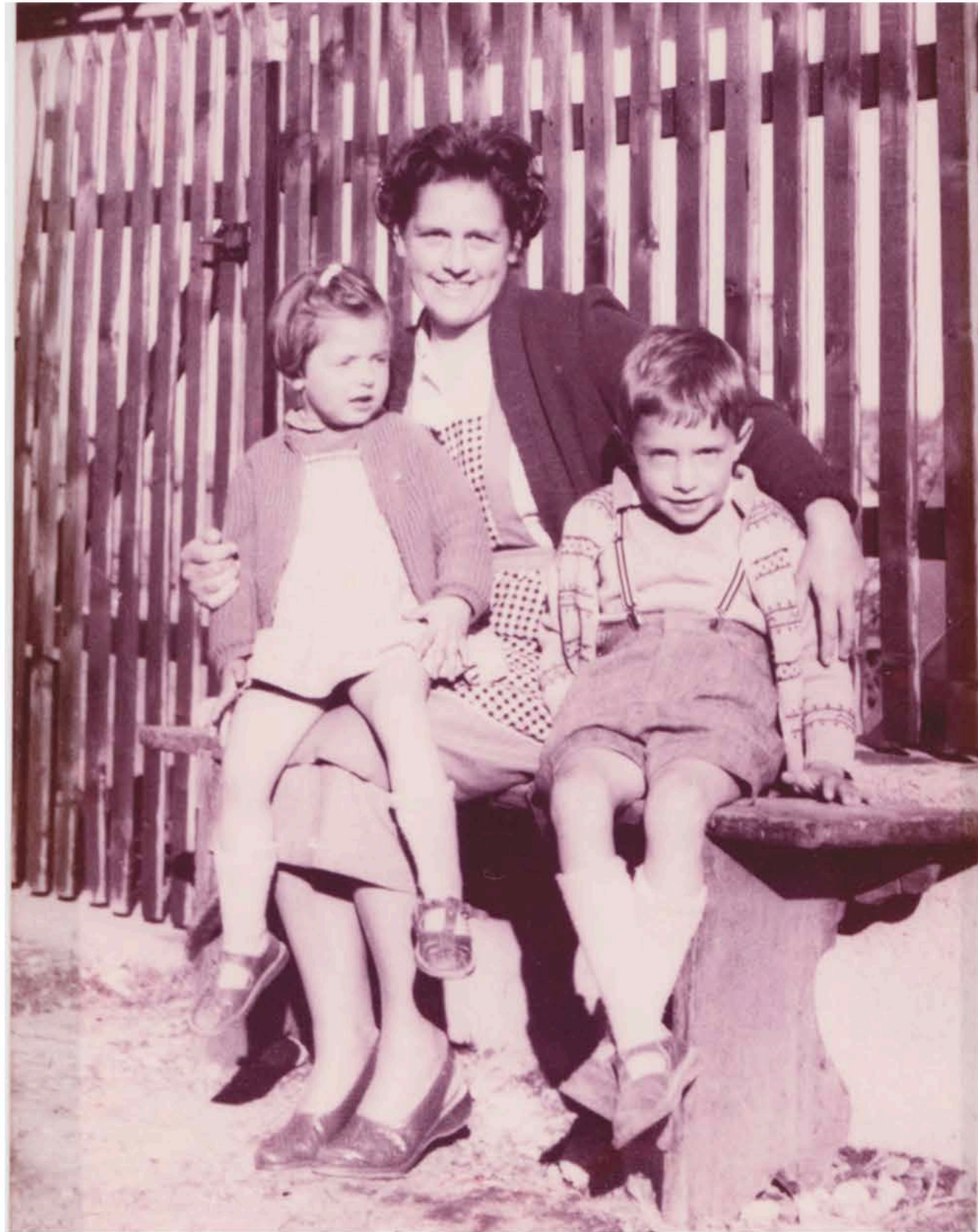
Diese Bild zeigt meine Mutter mit meinen zwei ältesten Geschwistern etwa anno 1961.