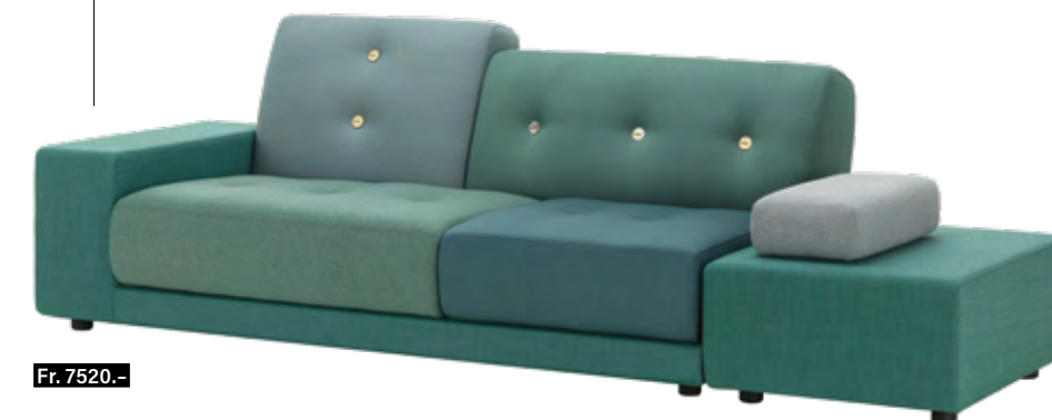
HINEINSINKEN Der asymmetrische Aufbau und seine liebevollen Details verleihen dem komfortablen Sofa «Polder» von Vitra, 2015 designt von Hella Jongerius, seine unverwechselbare Gestalt. intraform.ch

In der Kollektion «Veronica» von Edra sind die Modelle aus einem Polycarbonat in der klassischen grünen Farbe von Naturglas gefertigt und von Hand geformt. intraform.ch