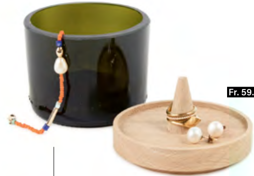
PERLENHÜTER Upcycling auf elegante Art und Weise: Dieses Schmuck- und Aufbewahrungsglas wird aus leeren Sektflaschen hergestellt. Die Designerin Rahel Mor will mit dieser Idee gebrauchten Materialien ein zweites Leben schenken und einen Beitrag zur Nachhaltigkeit leisten. fideadesign.ch