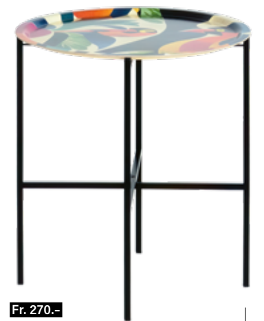
FRÖHLICHE ABWECHSLUNG Mit dem zusammenklappbaren Tischgestell aus Stahl werden die Servierplatten aus Birkenfurnier von HappyTrays im Handumdrehen zu eleganten Beistelltischen. In vielen Farben und Grössen erhältlich. happytrays.ch