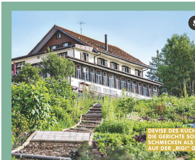
DEVISE DES KÜCHENCHEFS: DIE GERICHTE SOLLTEN SO SCHMECKEN ALS SEIEN SIE AUF DER „RIGI“ GEWACHSEN

Zimtschnecken schmecken offenbar nicht nur in Schweden, sondern auch in der Schweiz. Das „Café Nord“ holt die traditionelle schwedische Kaffeepause „Fika“ in die Neustadt. An der Tür prangt die charmante Aufschrift „Take yourself on Dates“ – verabrede dich mit dir selbst. Gelingt in der lässig skandinavisch eingerichteten Location super. Die Zimtschnecken? Ein Traum. cafenord.ch