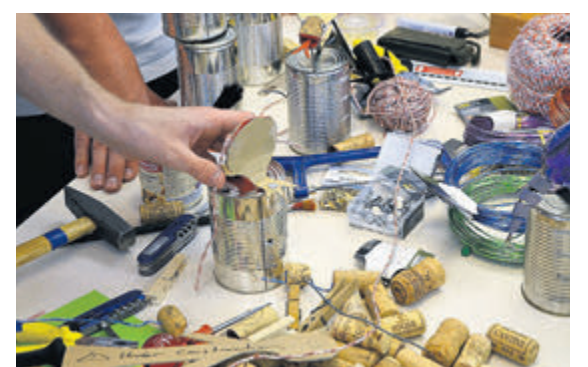
Zusatz Tipp: Workshop für Kids/Teens (ab 9): von Tüftelwerk, Luzern, fertiges Produkt zum Mit-nach-Hause-Nehmen (kostenlos).