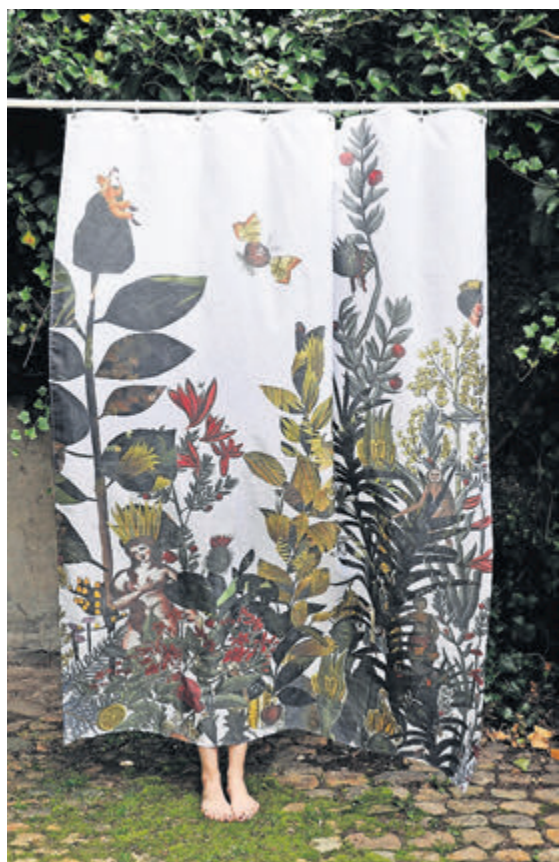
Duschvorhänge: aus 100 Prozent Baumwolle mit Acrylbeschichtung, 200 cm x 180 cm von Kollektiv vier, Basel (Fr. 135.-).