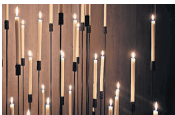
Kerzenständer Forêt: Atelier Juerg Mueller, von Renato Fontana, Luzern, angefertigt (exklusiv an Design Schenken: Fr. 125.-).