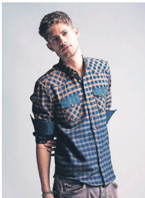
Kleider und Accessoires: von Einstoffen, St. Gallen, Hemd Korben Dallas, Flanell, verschiedene Stoffe (Fr. 119.-).