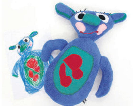
Stofftiere nach Kinderzeichnungen: von Eiswikeis, Olten, Stoffe, Füllung aus rezyklierten PET-Fasern (Unikat, Fr. 79.-).