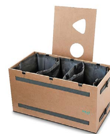
Trennen, sammeln, entsorgen: Boxen aus Materialien und Grössen, teils wetterfest, Separo, Baar (ab 120 Franken).