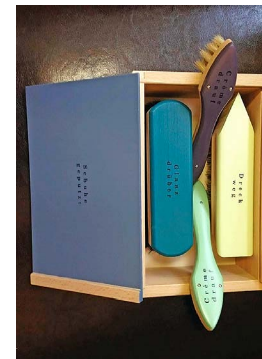
Schuhputzset: 4 Bürsten in Holzkiste, Blindenfürsorgeverein Innerschweiz und EigenmannDurot, Zürich (99 Franken).