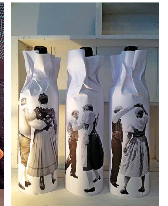
Verpackung: Papierhülle für Wein oder selbst gemachten Sirup. matrouvaile, Luzern (Dreier set 19 Franken).