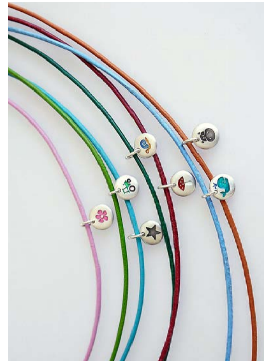
Kinderschmuck: Anhänger in Silber, mit geschwärzten oder farbigen Motiven, von müki, Luzern (ab 120 Franken).