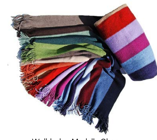
Wolldecke: Modell «Oban», aus feinsten Lammwolle, Caroline Flüeler, Zug (390 Franken).

• www.designschenken.ch: Die Internetseite gibt ausführliche Hinweise zu allen Ausstellern der Luzerner Designtage.