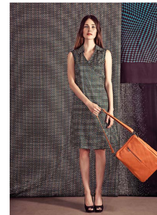
Tasche: Modell «Facile», Leder, aus der Sommerkollektion 2015, von Kleinbasel, Basel (459 Franken).