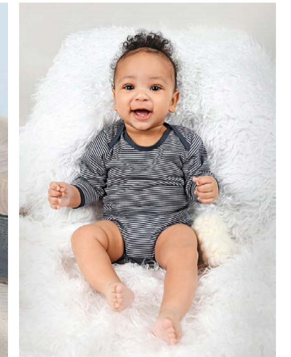
Mode: Baby-Body aus 100% neuseeländischer Merinowolle. Boo. Merino, St. Erhard (35 Franken).