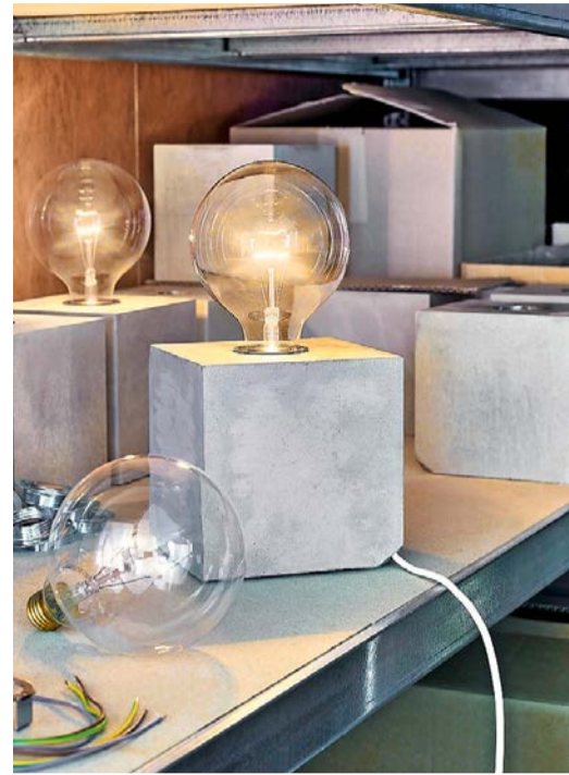
Licht: «Simpel Block» (Beton), dimmbar, Hommage an die Glühbirne, Lichtprojekte Deuber, Luzern (295 Franken).