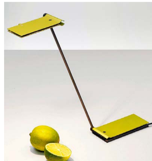
Leselampe: Modell «Zett», Lemon, mit USB-Anschluss, von Baltensweiler AG, Luzern (330 Franken, exkl. MWST).