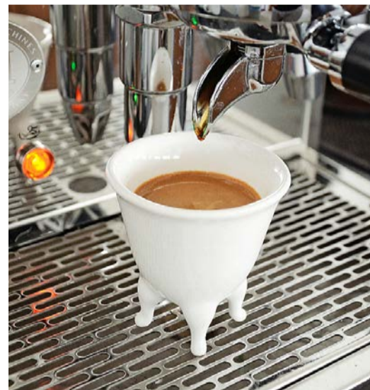
Espressomaschine: Modell «Vittoria», 3D-gedruckt aus Porzellan, hergestellt vom Inuk Kollektiv, Luzern (42 Franken).