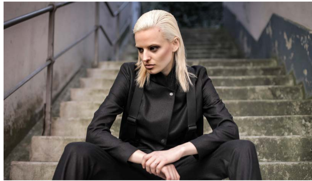
Mode: Zwischen klassischer Eleganz und modernem Street-Style. Schal, Jacke und Hose, anthrazit, aus feinsten Wolle. velvet novel, Luzern (45/490/320 Fr.)