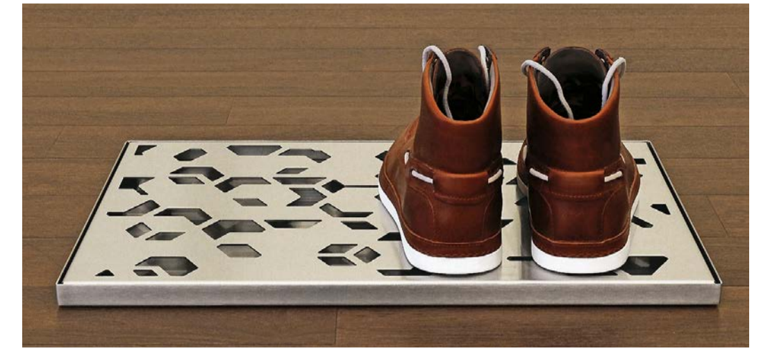
Schuhablage: Edelstahl geschliffen, 52 x 34 x 2 cm. Neustahl, Luzern (240 Franken).