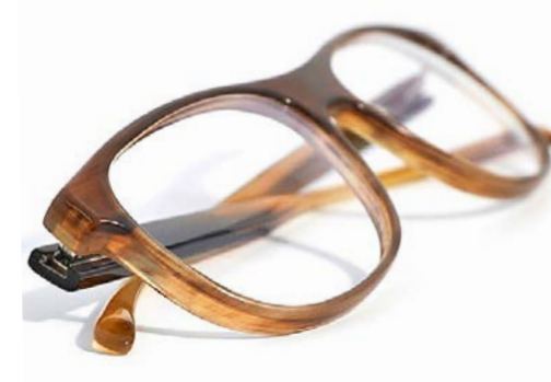
Büffelhornbrille: Leicht, hautfreundlich, individuell im Farbton, nicht aus Tierzucht. Götti+Niederer, Luzern (ab 1080 Franken).