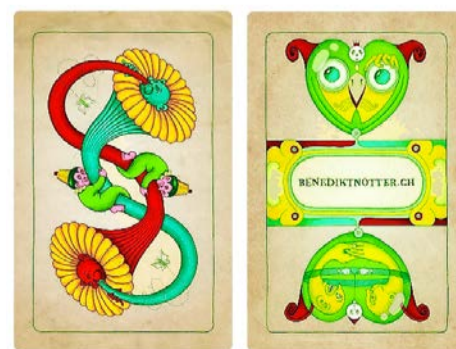
Verspielte Jasskarten: nah am Original, fantasievoll und witzig gestaltet, von Benedikt Nottter, Luzern (15 Franken).