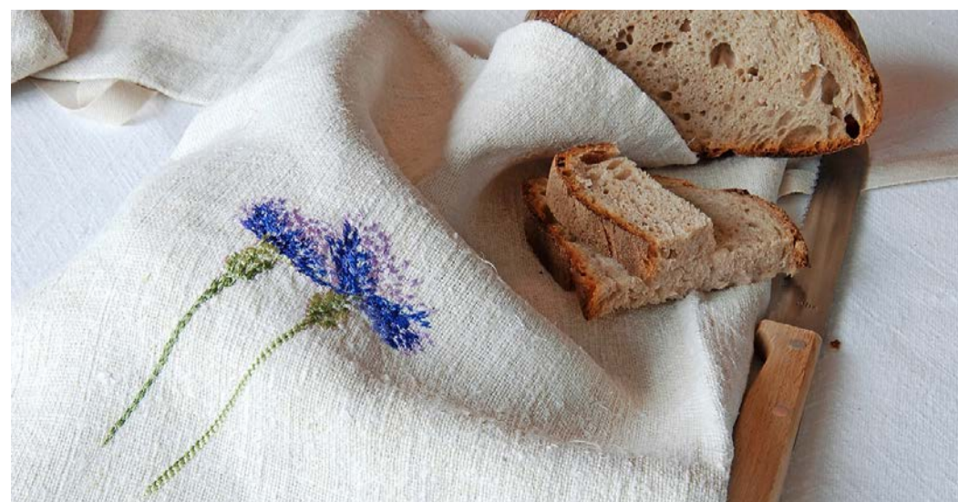
Brotsack: Handgewobenes Leinen, konfektioniert von Stiftung Brändi, konzipiert, gestaltet, bestickt von Waldburger Manufaktur, Luzern (ab 120 Franken).