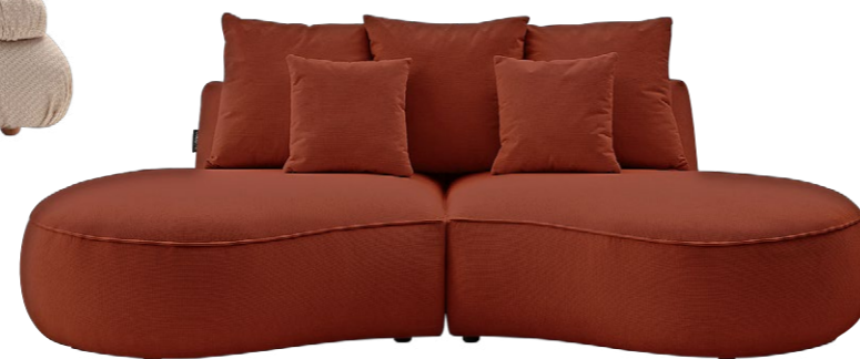
Conforama Sofa Saint-Germain aus der Bobochic-Linie, ab CHF 1299.-

Der Trend war absehbar – weg von rigiden Strukturen hin zu den Sofalandschaften der 70er. Die Polstermöbel sind so wieder bodennah mit fast oder ganz unsichtbaren Füßen. Die Rücken- und Armlehnen sind tiefer, einzeln oder gar nicht vorhanden. Oft scheinen die Sofas zwischen Skulptur und Möbelstück angesiedelt zu sein, so wie Edras Klassiker On The Rocks mit frei platzierbaren Stützen. Die Modelle bestehen aus Modulen, die nach Belieben immer