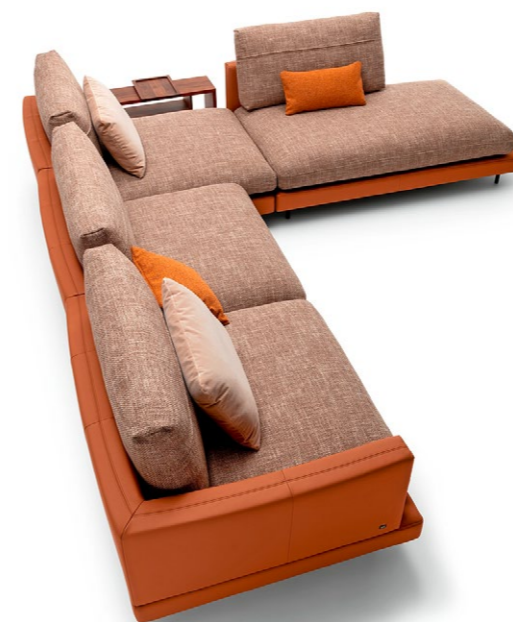
Rolf Benz Jubiläumsneuheit: Sofa Sina aus Leder oder Stoff mit oder ohne Rückenlehne, ab CHF 5422.-