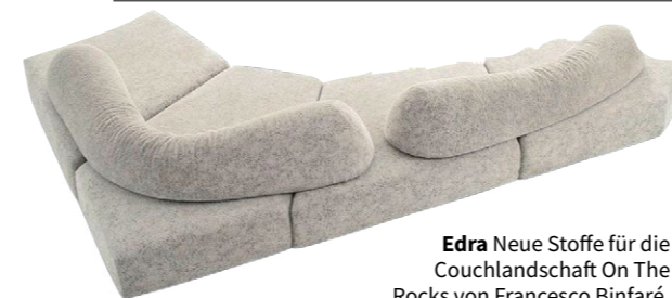
Edra Neue Stoffe für die Couchlandschaft On The Rocks von Francesco Binfaré, Modul Preis auf Anfrage.