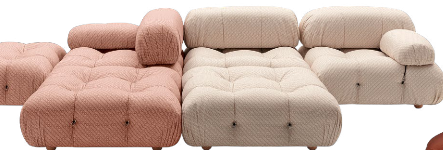
Stella McCartney x B&B Italia Limitierte Special Edition des Sofas Camaleonda, ab CHF 4200.-