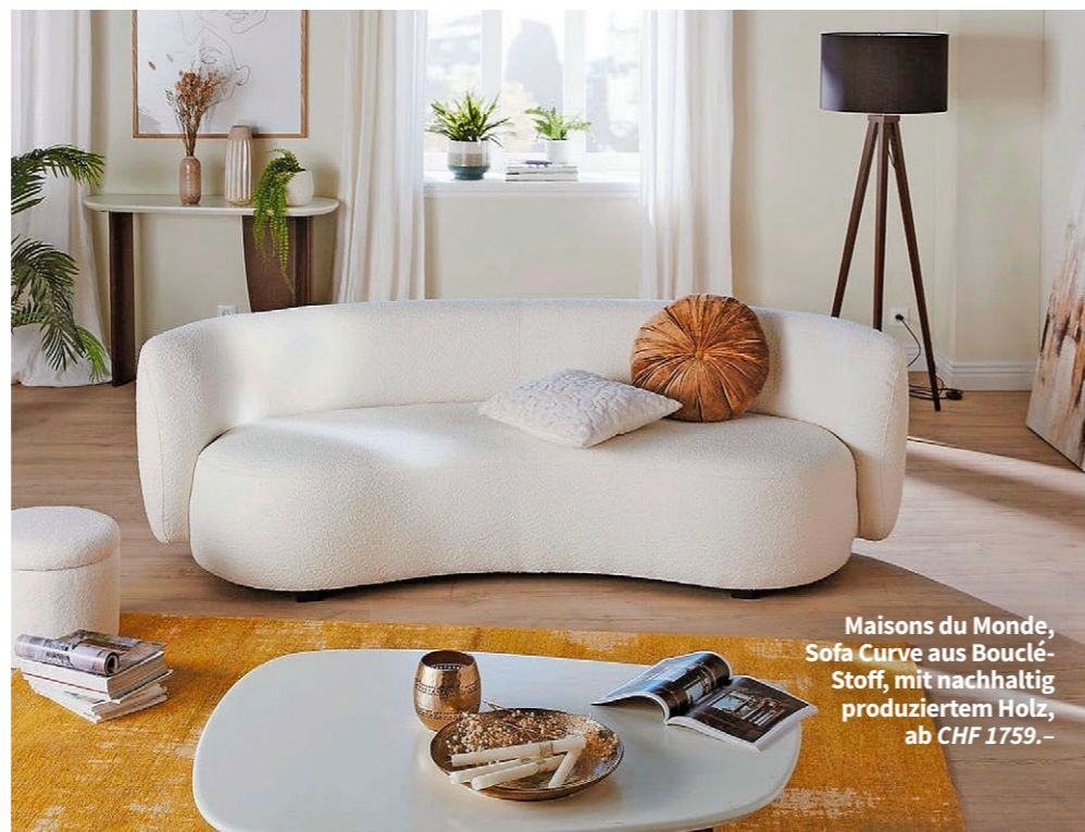
Maisons du Monde, Sofa Curve aus Bouclé-Stoff, mit nachhaltig produziertem Holz, ab CHF 1759.-

Couch-Potatos aufgepasst: Die Polstermöbel-Entwicklung geht vom cool-minimalistischen Skandi-Design in Richtung des positiven Individualismus der 70er-Jahre. Bequemlichkeit und Lounging sind jetzt wieder salonfähig.